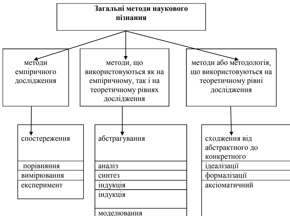
Рисунок 1.3. Загальні методи наукового пізнання

Загальні методи наукового пізнання, на відміну від спеціальних, використовуються в дослідницькому процесі в різноманітних науках (рис. 1.3.) .